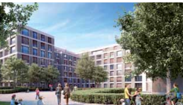
Visualisierung Innenhof Baufeld B4S

Aktuell stehen wir mitten in den Verhandlungen mit der Losinger Marazzi AG und hoffen, dass der Totalunternehmer-Vertrag bis Ende Jahr unterschrieben werden kann.